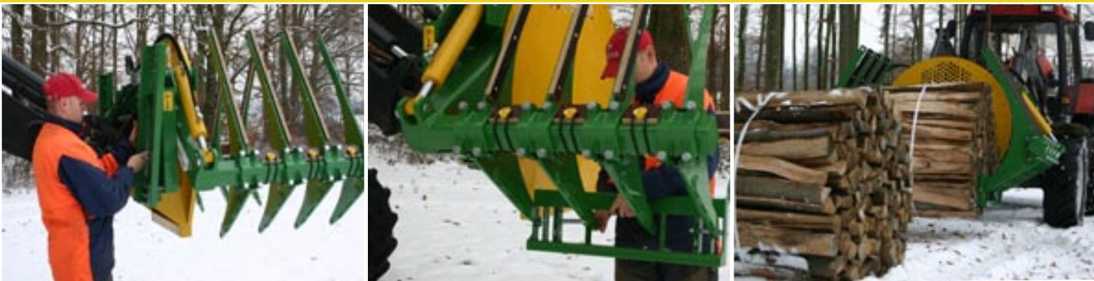
Montage der Querstreben, um das Bündel seitlich zu packen.